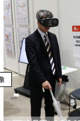
枚方市長にも体験いただきました！