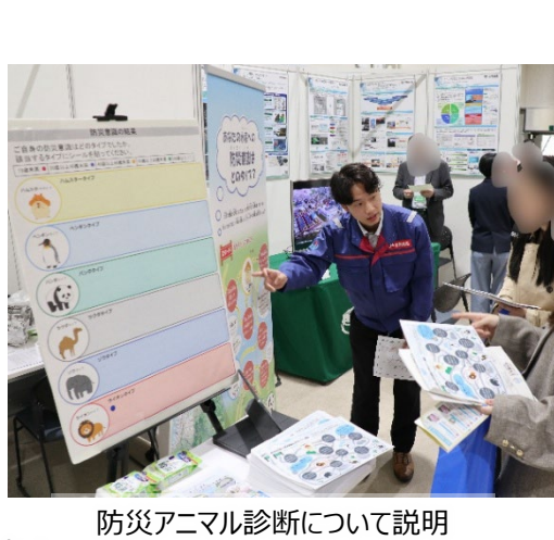
防災アニマル診断について説明