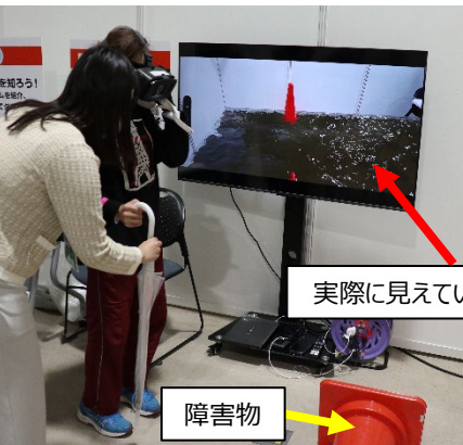
体験の様子と見えている画面

浸水している映像を流し、2メートル先のゴールを目指します。 下が見えない状態で障害物をよけて歩行していただきました！