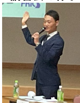
開会挨拶 川西町長