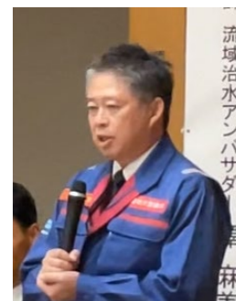
閉会挨拶 大和川河川事務所長