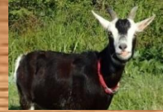
リーダー カゴ (♀) トカラヤギ 白黒の毛色