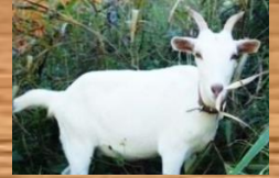
ウメ (♀) シバヤギ 角があり白の毛色