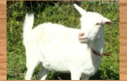
ポース (♀) シバヤギ 角がなく坊主頭