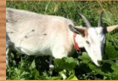
シンディー (♀) トカラヤギ ベージュの毛色