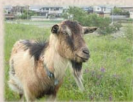
ミヨ ♀ トカラヤギ 背筋が黒毛の 女の子