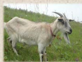
シンティ ♀ トカラヤギ 立派な角の 女の子