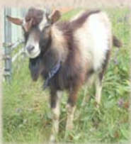
メイコ ♂ トカラヤギ 唯一のオスで リーダー