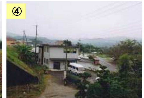
④ 自動車学校が位置している