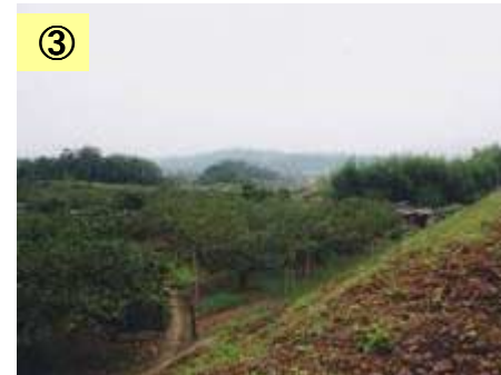
③ 田畑として利用されている