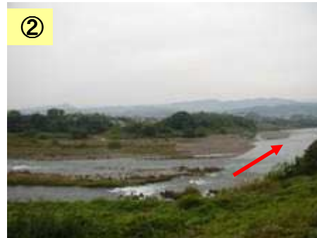
② 植生が繁茂している