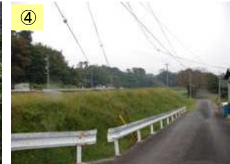
④ 田畑が広がっている