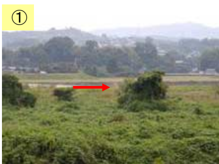
① 築堤工事が未実施

※農業振興地域及び農用地区域は、1/25,000スケールからの転記であり、地籍等は考慮していない。