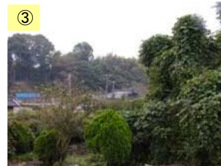
③ 人家が立地している