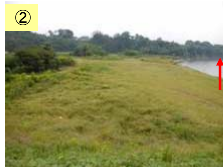
② 築堤工事が未実施