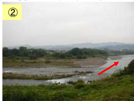
② 植生が繁茂している