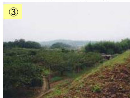
③ 田畑として利用されている