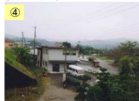
④ 自動車学校が位置している