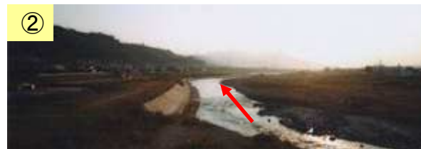
←土砂が堆積している。