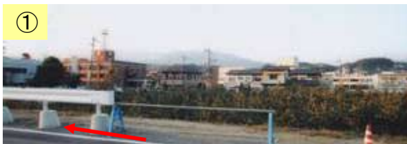
↑ 堤内地は橋本市の中心市街地である。

※農業振興地域及び農用地区域は、1/25,000スケールからの転記であり、地籍等は考慮していない。