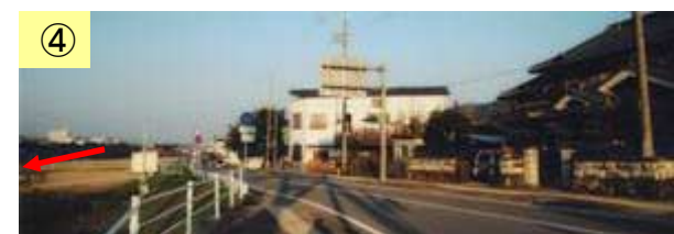
↓ 人家が立地している。