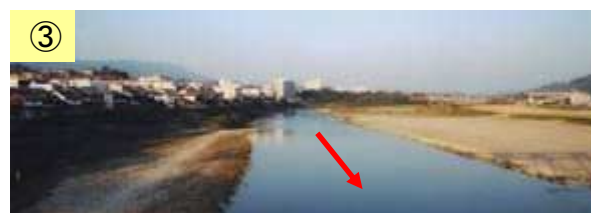
土砂が堆積している。→