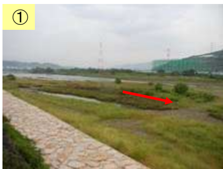
① 築堤工事が未実施

※農業振興地域及び農用地区域は、1/25,000スケールからの転記であり、地籍等は考慮していない。