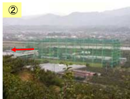
② ゴルフ練習場が立地している