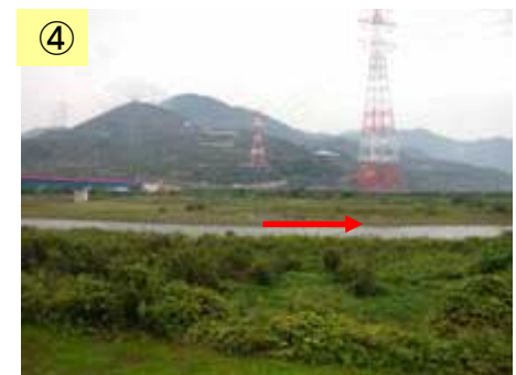
④ 築堤工事が未実施