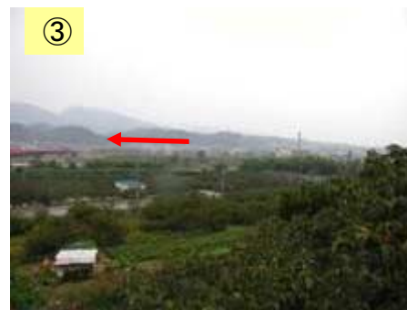
③ 人家が点在している