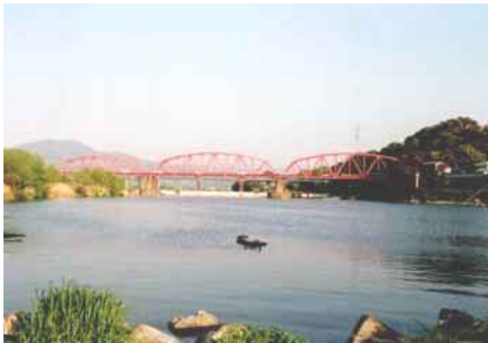
岩出町下流より上流