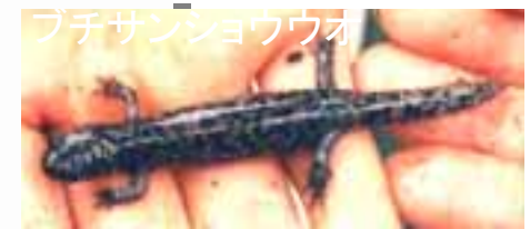
ブチサンショウウオ