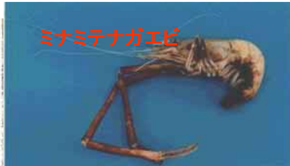
ミナミテナガエビ