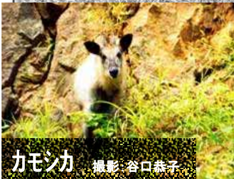
カモシカ