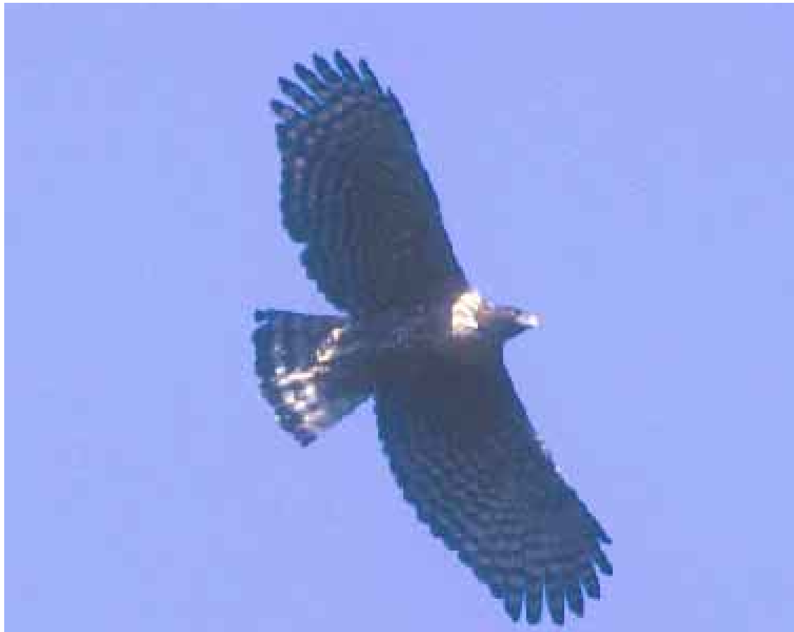
クマタカ飛翔状況

環境調査の結果、事業予定地周辺において、天然記念物のカモシカ、ヤマネ、希少猛禽類のクマタカ、オオタカなどをはじめとし、レッドデータブック掲載種など希少な生物の生息・生育を確認しています。