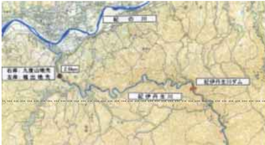
平常時の紀伊丹生川

昭和57年8月3日出水において、紀伊丹生川ダムがあった場合、約3mの水位低減効果が予測されます。