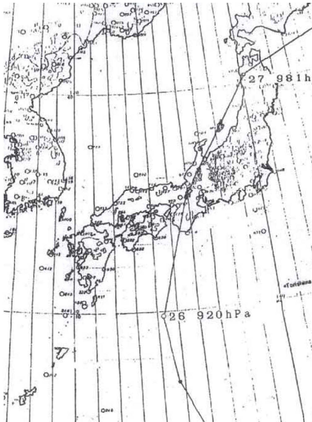
伊勢湾台風経路図

昭和34年9月26日、日本に上陸した超大型の台風15号(伊勢湾台風)は、時速70~75kmという早い速度で紀伊半島から本州を縦断し、各地に大きな被害をもたらしました。