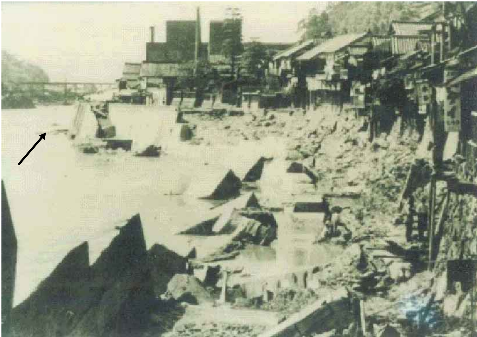
国道169号 吉野町上市付近