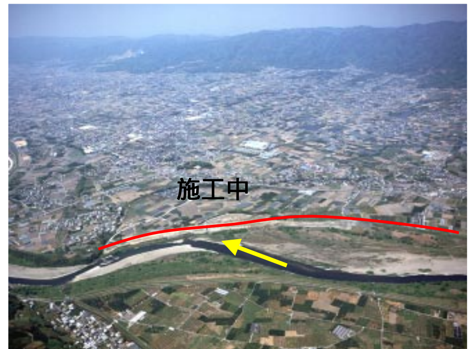
施工中（平成13年4月頃状況）