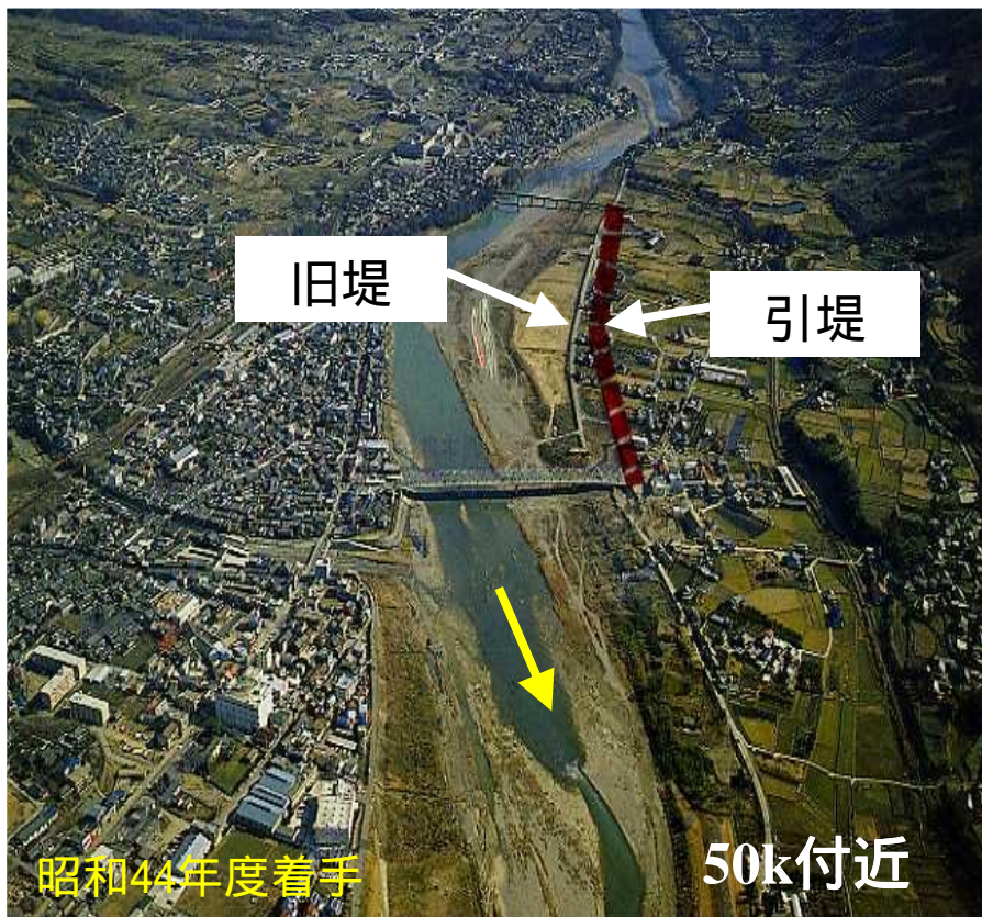
施工前（昭和56年頃状況）