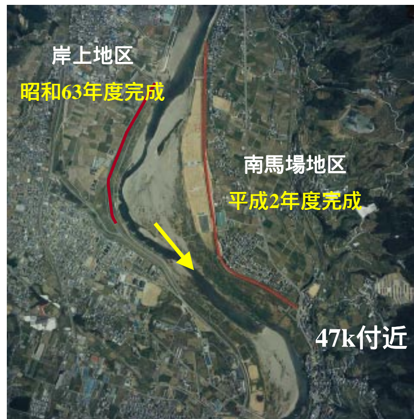
施工後（平成8年頃状況）