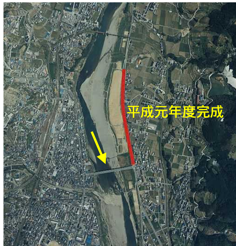
施工後（平成8年頃状況）