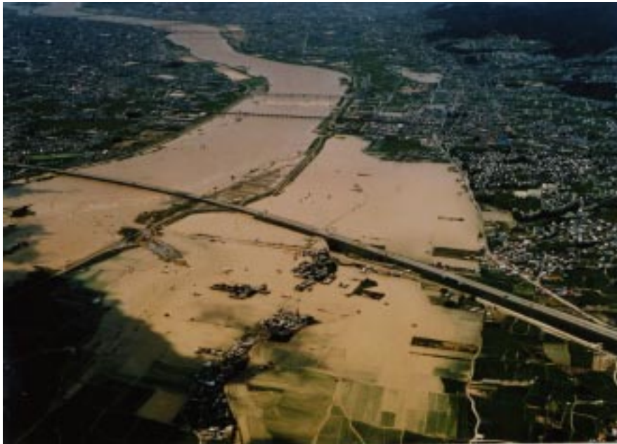
昭和57年 台風10号 床上浸水179、床下浸水4511 (水害統計より) 写真は和歌山市直川地区の内水状況