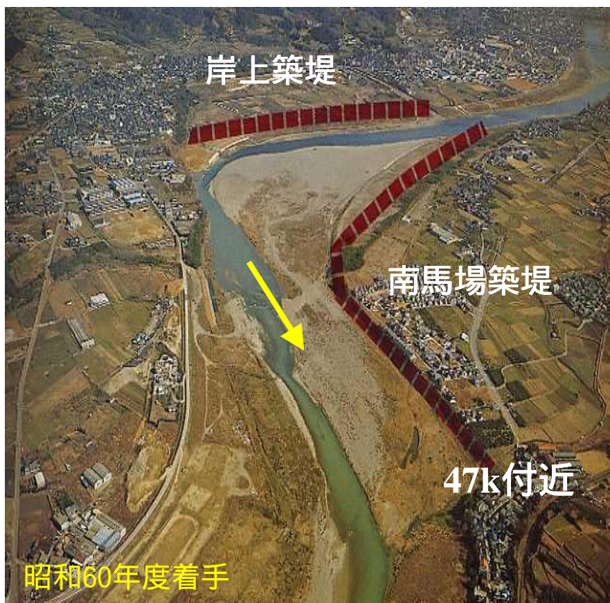
施工前（昭和56年頃状況）