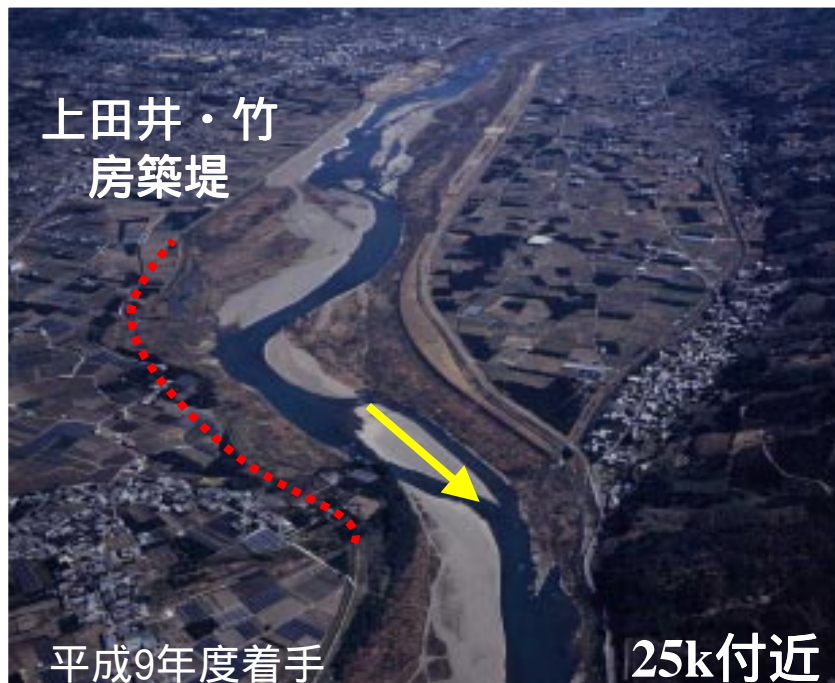
施工前（平成6年頃状況）