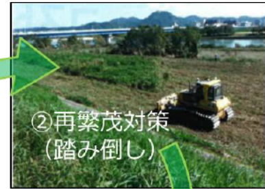
②再繁茂対策 (踏み倒し)