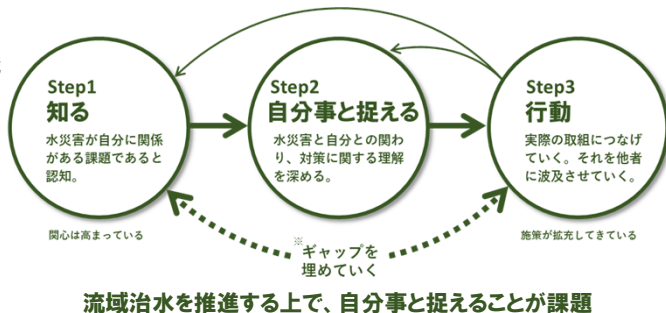
流域治水を推進する上で、自分事と捉えることが課題

水災害から自身を守ることからさらに視野を広げて、地域、流域の被害や水災害対策の全体像を認識し、自らの行動を深化させることで、流域治水の取り組みを推進する。 ※流域治水に取り組む主体を増やす(自分のためから、みんなのために)