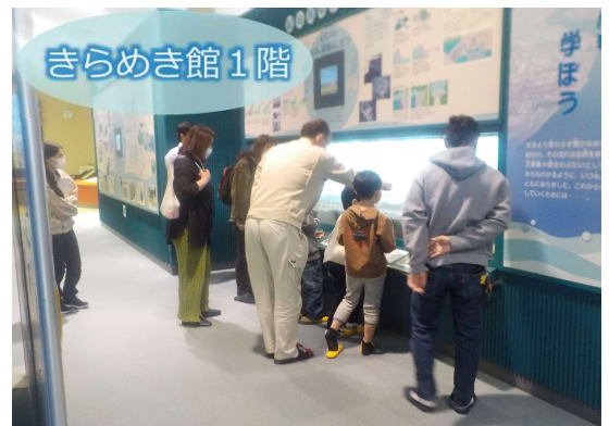
放課後等デイサービス放課後クラブオーパ

紀の川の模型を見ながら、「これが紀の川でね…」と説明中。小学校低学年でしたが、熱心に聞いてくれました。