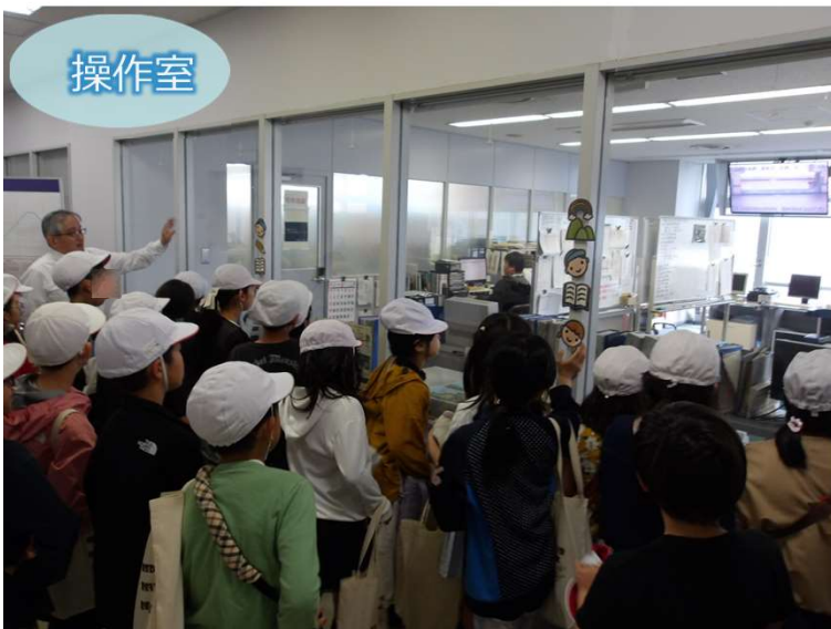
和歌山市立伏虎義務教育学校4年生