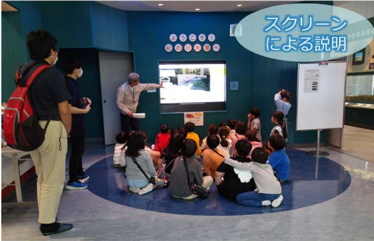
和歌山市立有功東小学校4年生

令和6年4~5月、団体で来館された皆さんに、和歌山河川国道事務所紀の川下流出張所と河川管理課の職員が案内をしました。団体見学では、スクリーンを使った説明や、屋上・操作室・魚道への案内をしています。