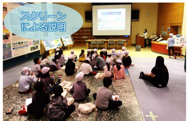
和歌山市立伏虎義務教育学校4年生

紀の川大堰について、説明中。紀の川大堰は、洪水の時に安全に水を流す等、4つの役割があるんです。