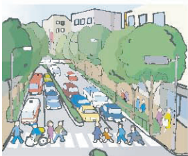
片側2車線以上の 道路