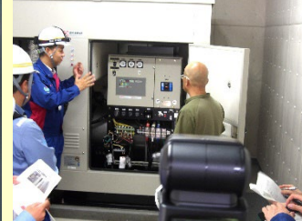
自家用発電機の操作