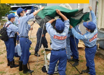
仮設トイレの組立