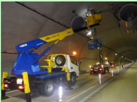
トンネル換気設備点検

安全に走行していただくために 舗装修繕、交通安全施設設置、トンネルや 橋梁の設備点検等を行います。