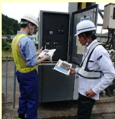
電動操作盤による遮断機の操作