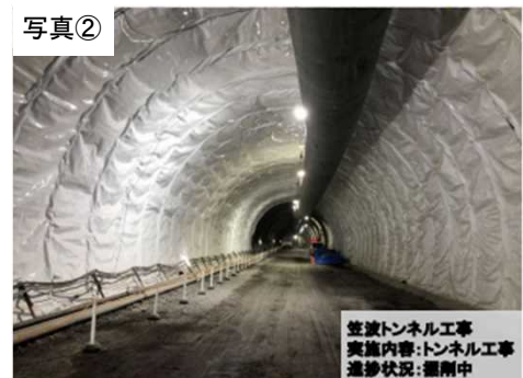
※写真は令和3年5月下旬時点