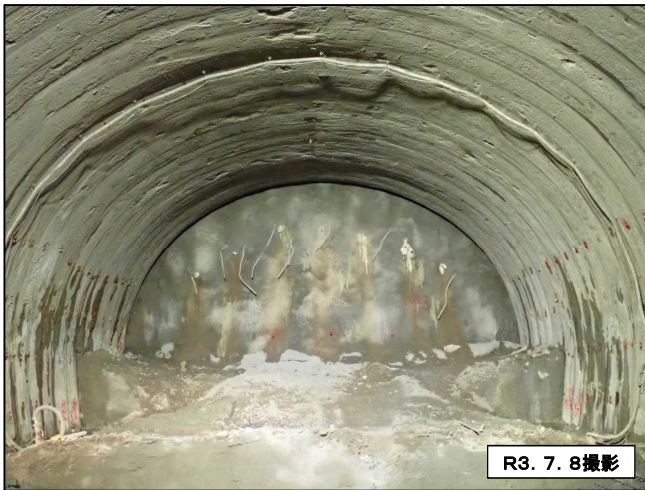
トンネル内貫通前