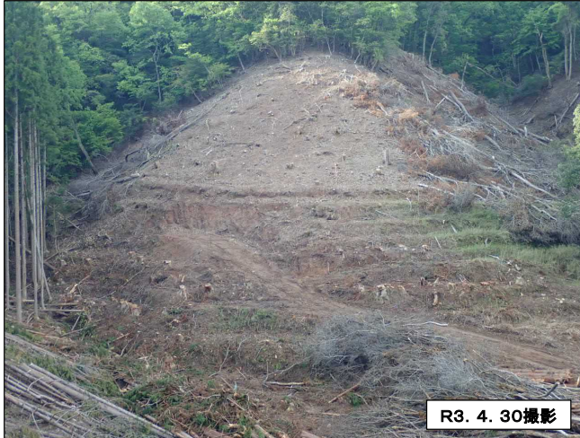
トンネル坑外貫通前 (上佐野側)