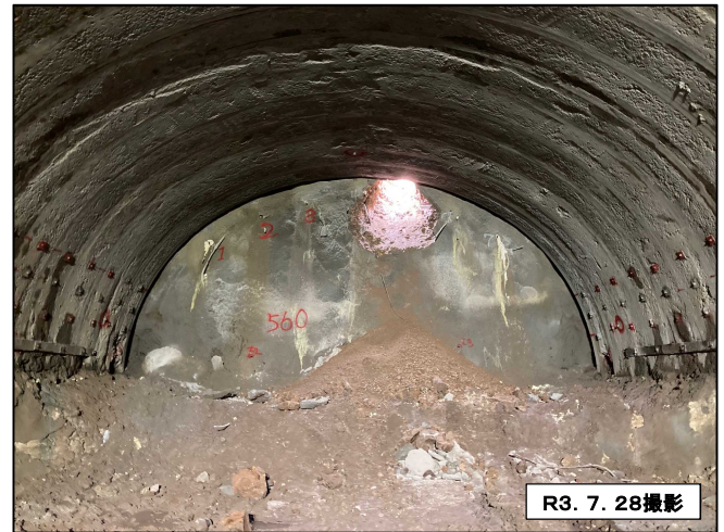
トンネル内貫通後