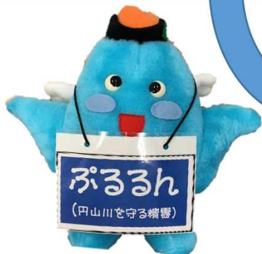
豊岡河川国道事務所オリジナルキャラクター ぷるるん (円山川を守る精霊)