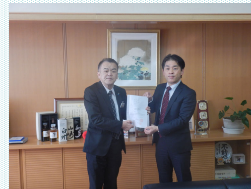
【事務所長(右)から香美町長(左)へ】

【問合せ先】 国土交通省 近畿地方整備局 豊岡河川国道事務所 道路管理課 〒668-0025 住所 兵庫県豊岡市幸町10-3 TEL 0796-22-3126 (代表)