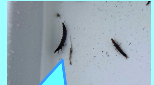
カワゲラが採れたよ！