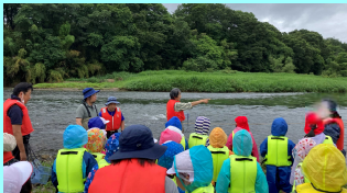
まずはライフジャケットの正しい付け方を聞きました。