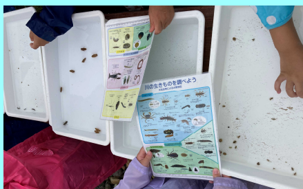
採取した水生生物をトレイに入れ種類の分別をしました。