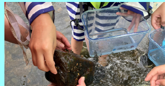
水生生物は石の裏に隠れています。