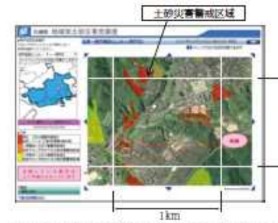
③地域別土砂災害危険度で新たに表示する画面イメージ