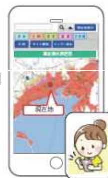
スマートフォン専用サイト (CGハザードマップ)で検索