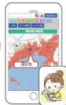
スマートフォン専用サイト (CGハザードマップ)で検索