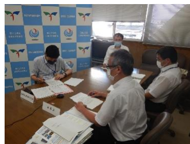
協議会の様子(豊岡河川国道事務所)