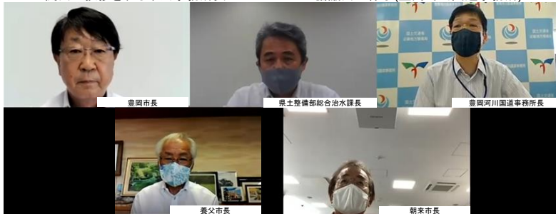
オンラインによるWEB会議