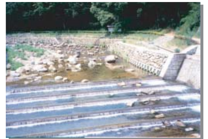
遡上を容易に(全面多段落差工) 養父町船谷(ポケットパーク船谷)