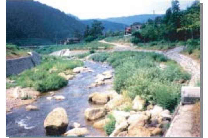
柳の植生(梓組護岸工) 養父町森(ポケットパーク森)