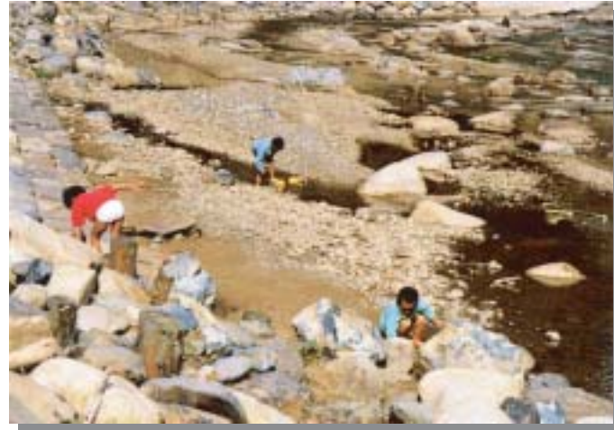
降りて遊びやすくなった緩傾斜護岸 養父町大坪(ポケットパーク大坪)