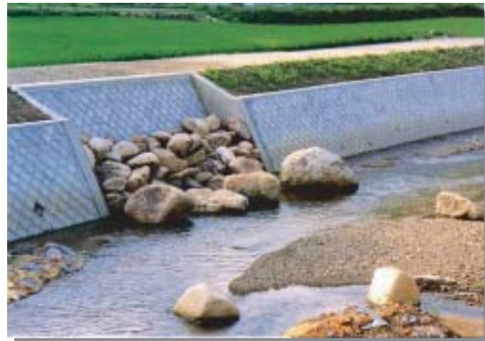
水生生物の避難場所(石寄巣穴工) 養父町森