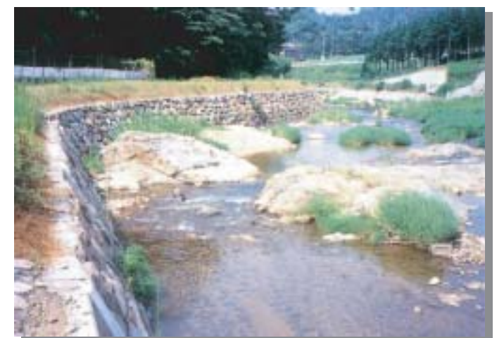
瀬と淵の再生 養父町森(ポケットパーク森)