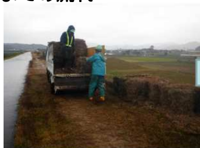
▲ 集草作業後にロール化した刈草を積込