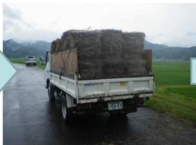
▲ 配布希望者のもとにロール化した刈草を運搬