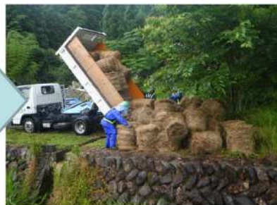
▲ ロール化した刈草を提供