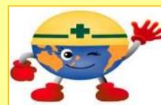
ドボク君 「土木学会関西支部マスコットキャラクター」