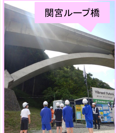
国道9号維持管理業務