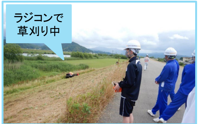
円山川維持管理業務体験