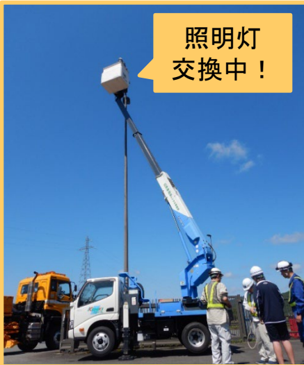
災害対策用機械体験