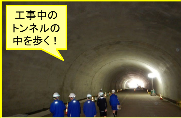
北近畿豊岡自動車道を見学