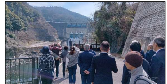
天ヶ瀬ダム観光放流の様子