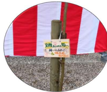
宇治市長のメッセージプレート