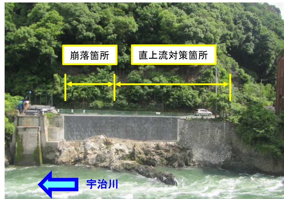
本復旧完了(令和6年6月3日撮影)