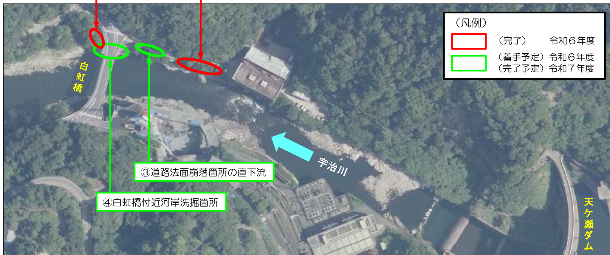
①道路法面崩落箇所(直上流対策箇所含む)