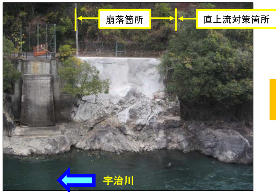
着手前(令和5年11月28日撮影)