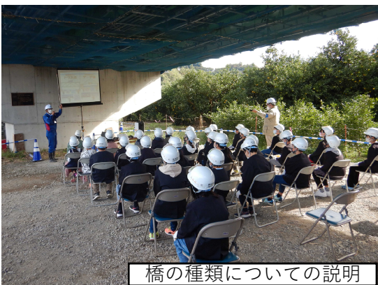
橋の種類についての説明