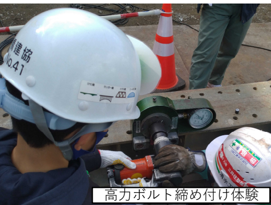
高力ボルト締め付け体験