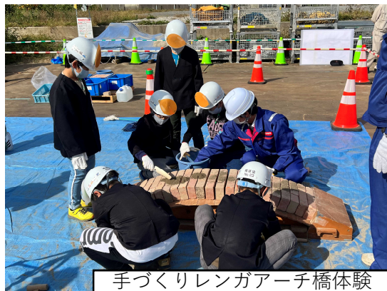
手づくりレンガアーチ橋体験