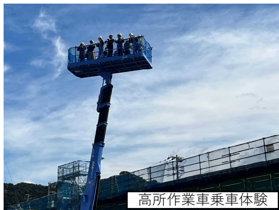
高所作業車乗車体験