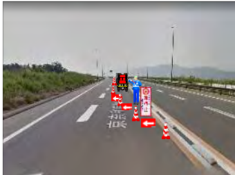
(上り本線強制流出規制)

平成31年3月 1日(金)20:00~3月 4日(月)5:00 平成31年3月 8日(金)20:00~3月11日(月)5:00