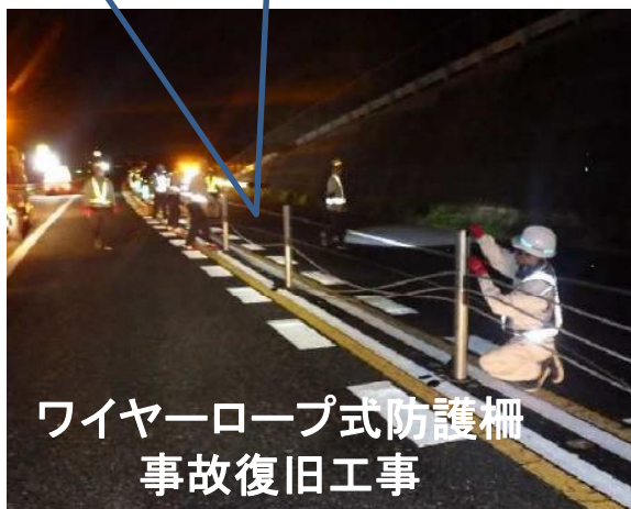
ワイヤーロープ式防護柵 事故復旧工事