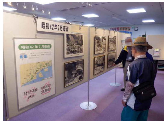
灘区文化センター