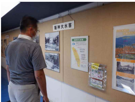
芦屋市民センター