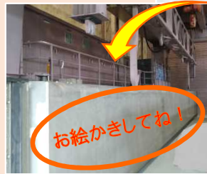
クレーンで運ぶ 予備ゲート