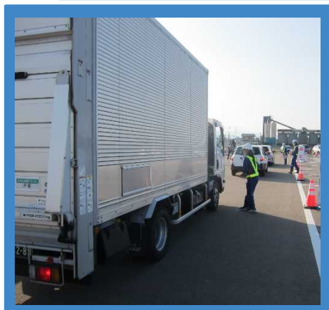
冬用タイヤチェック訓練