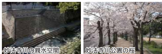
妙法寺川の親水空間

妙法寺川公園は、妙法寺川両岸にある桜の名所です。開花時には、約400本の桜が素晴らしいトンネルをつくります。平成24年（2012年）より親水空間も整備され、より自然に親しみやすい公園となりました。