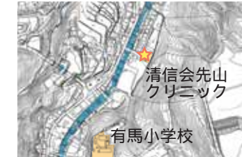
清信会先山クリニック

昔は有馬川に架かる乙倉橋を渡ると、立派な駅舎の有馬駅がありました。今は病院になっています。