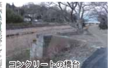
コンクリートの橋台