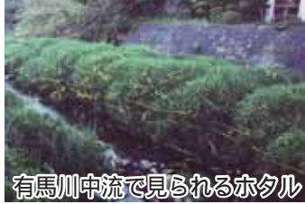
有馬川中流で見られるホタル