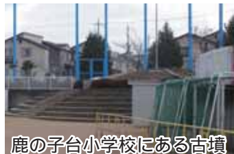
鹿の子台小学校にある古墳