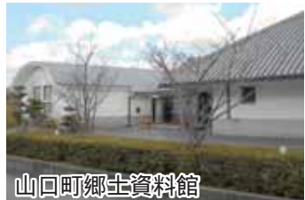
山口町郷土資料館

「山口町郷土資料館」は、美しい自然と風土を持つふるさと「山口町」の文化遺産を、後世にまできちんと伝え残すために建てられました。遠く中世以前から現在までの数多くの資料が、見やすく収集保存されています。