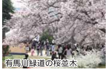
有馬川緑道の桜並木

有馬川緑道は、六甲山地から武庫川に合流するまで、有馬川に沿うように、1.3kmの緑道が整備された散歩道です。春は桜が咲き乱れ、地域の人たちの手作りのさくらまつりでにぎわいます。また、初夏にはたくさんのホタルが飛び交います。