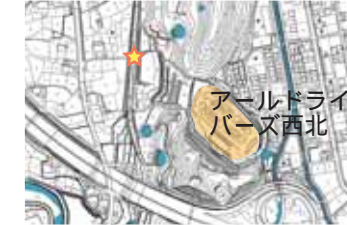
アールドライバーズ西北