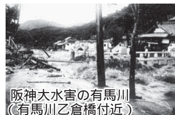
阪神大水害の有馬川（有馬川乙倉橋付近）