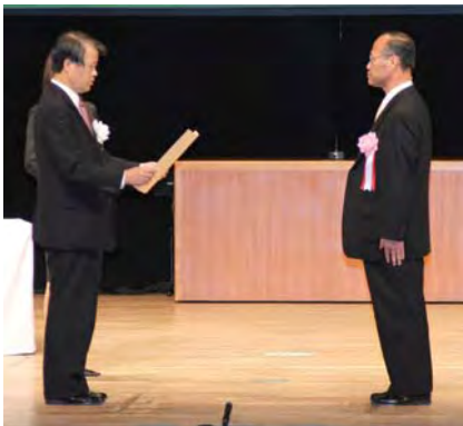
土砂災害防止推進の集い (全国大会)での表彰式