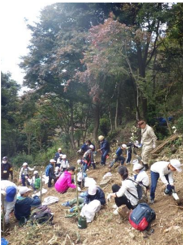
がんばって植えています