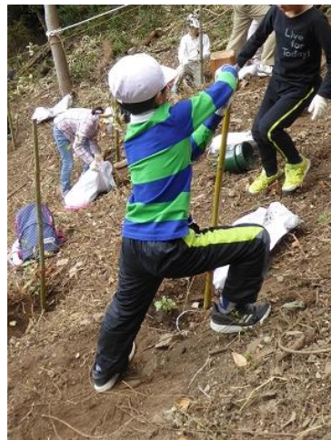
踏ん張りながら木づちを使います