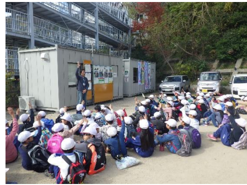
どんぐりは何のために植えますか？