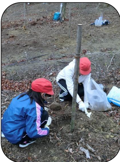
協力して植樹をします