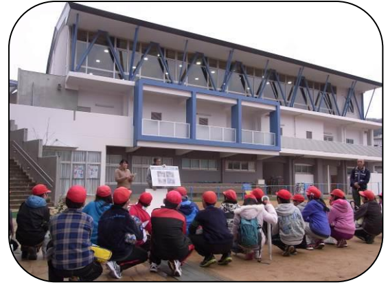
六甲山で見られる砂防えんていの説明

「土はどのくらい入れる」「なわはどう結べばいいの」「竹の支柱が割れたよ」とにぎやかな声が飛び交いました。「獅子ヶ池に通じる道を覚えてまた見に来よう」「手入れをして下さる方への感謝の気持ちを忘れずにいよう」と卒業記念植樹を終えました。