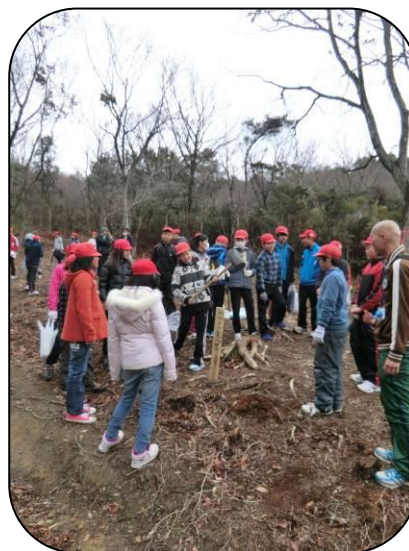
みんなの気持ちを込めて木槌を打ちます