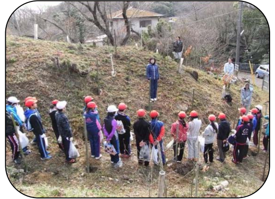
校長先生の話で最後の行事開始

植え方の説明を聞いた後、2 人一組で植樹開始です。お互いに協力して、助け教えあいながら楽しく植えました。獅子ヶ池からくんだたっぷりのお水をあげた後は、獅子ヶ池をながめながらの俳句作りやスケッチが始まりました。今日の苗木が、先輩の苗木のように大きく育つことを願いながら、思い出に残る 1 枚を書き、6 年生最後の行事を終えました。