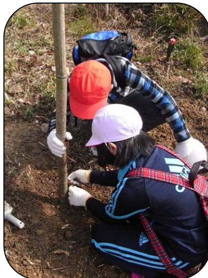
もうすぐ出来上がり