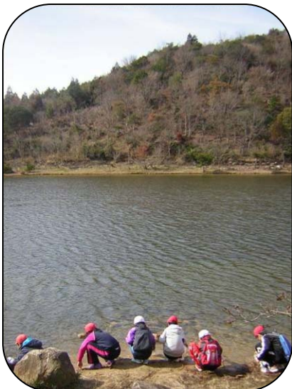
獅子ヶ池での水汲み