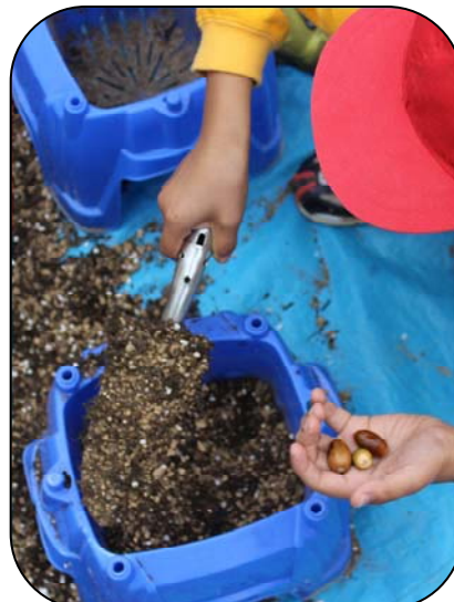
土をたっぷり入れます