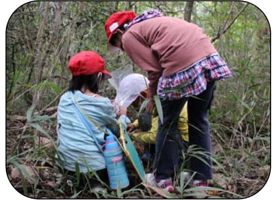
かんたんにどんぐりが見つかりました

渦が森小学校の3年生4クラス127人が、卒業時に植える苗を育てるため、学校の近くの山でどんぐり拾いをしました。