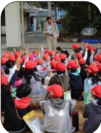
問題に手をあげて答えます

「なぜ生きてるどんぐりは水にしずむの?」など、多くの質問があり、土砂災害やどんぐりへの関心が高まったようでした。