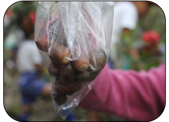
根が出ているどんぐり

あちらこちらにたくさんどんぐりが落ちており、ふくろにいっぱい集まりました。中にはもう根が出ているどんぐりもありました。