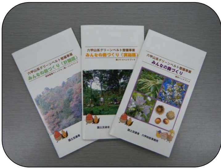
講習会で配布された資料（ハンドブック）

続いて行った、注意すべき危険生物の対処方法や、森づくりの状態を自分で記録する「森の成長記録」の調査方法についての講習にも、参加者は真剣に耳を傾けていました。