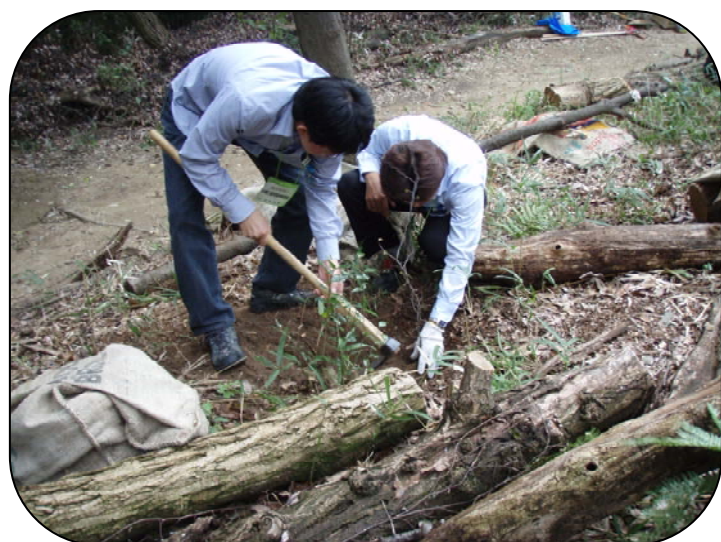
植樹方法の技術講習

参加者からは、「この講習会で学んだ内容を自分達の活動地でも実践したい」との声も聞かれ、有意義な講習となりました。