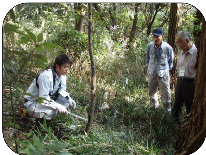
伐採方法の技術講習

森づくりの技術講習で参加者は、伐採から植樹までの一連の流れを体験しました。森づくり経験のない参加者は活動のイメージを得ることができ、経験者は安全で効率のよい道具の使い方などを学ぶことができたようです。