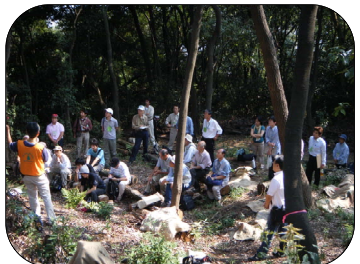
「いたやにすと」さんの経験談に耳を傾ける参加者