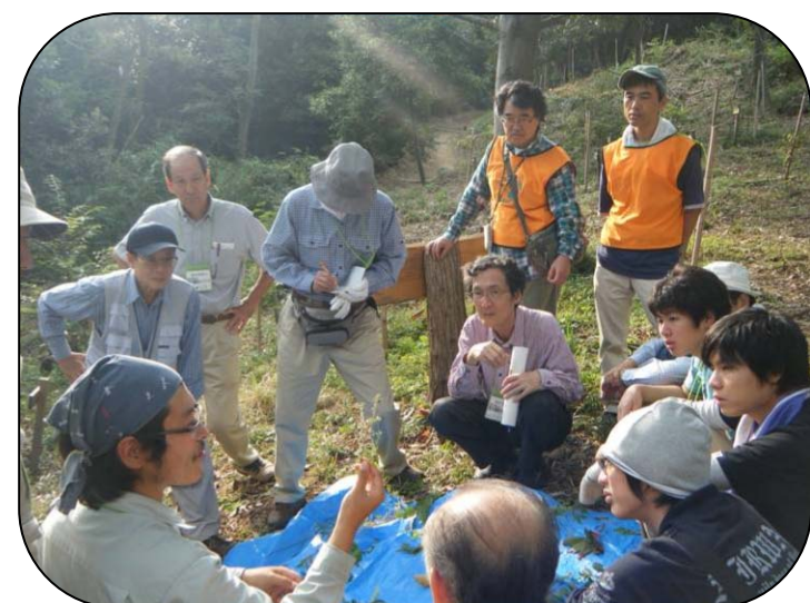
森の成長記録の説明