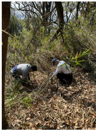
太いネザサに苦闘中