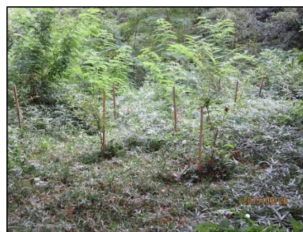
前回までの植樹地